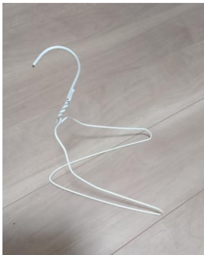
←変形した状態（女性でも簡単）